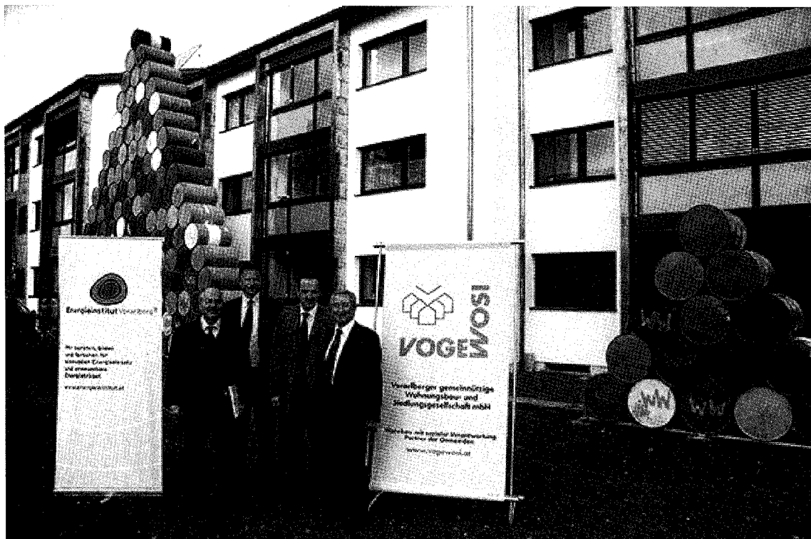
Abb. 3: Faktor 10 Sanierung der Wohnhausanlage Rankweil - Schleipfweg. Fertigstellung 2007