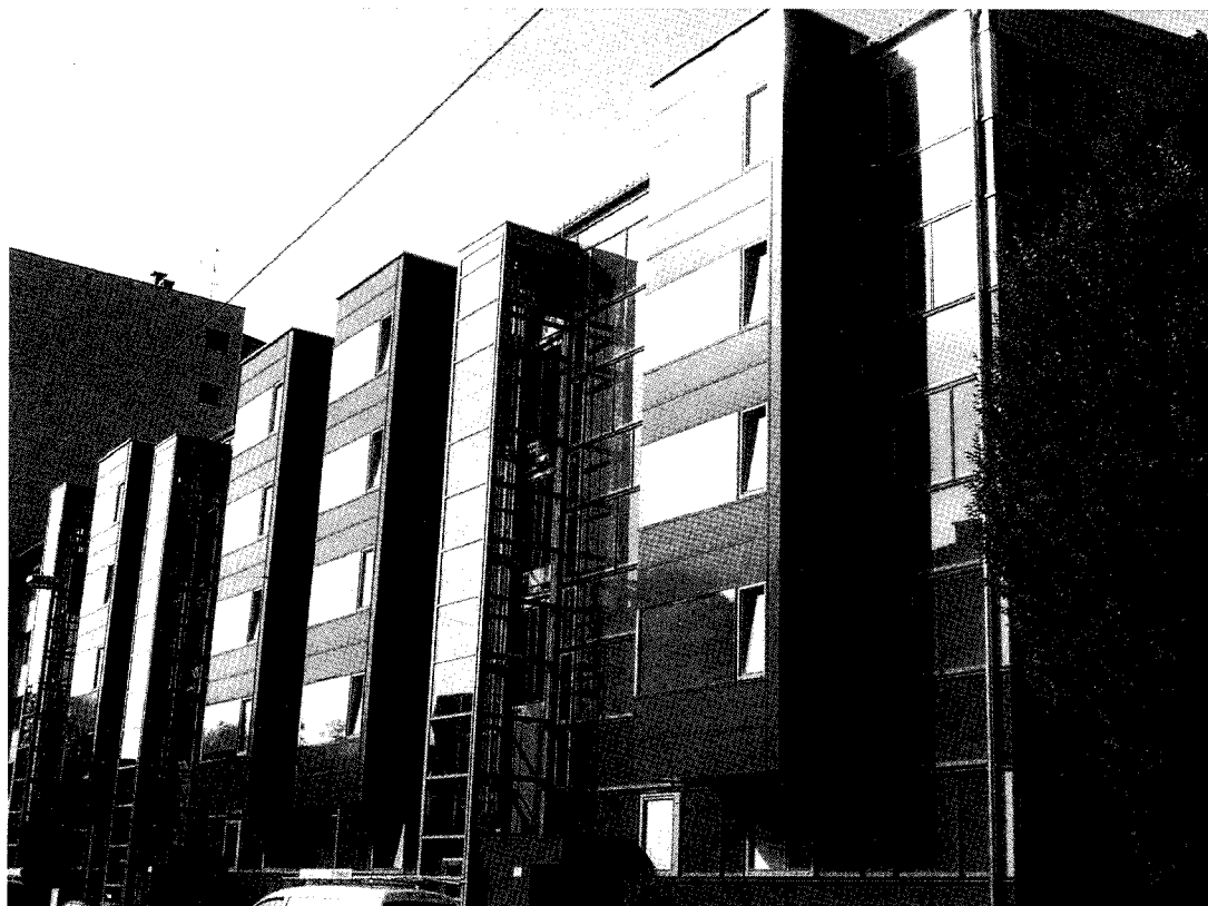
Abb. 4 und 5: Sanierung der Wohnhausanlage Makartstraße in Linz mit vorgehängten Fassadenelementen. Fertigstellung 2006